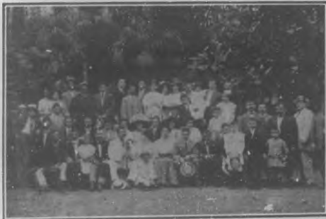
LA GIRA DE LOS CANSINOS

No sabemos si lamentarnos al hacerlo; pero no titubemos, y sin comentario alguno publicamos una vista del establecimiento del distinguido y joven electricista Ber-