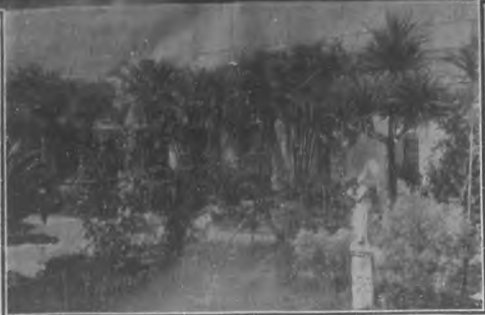
Vista exterior del edificio. Salón de tertulia. Salón de bailes. Un aspecto de los jardines.

La sociedad Liceo de Sagua la Grande es, sin disputa, una institución prestigiosa, y por su elegancia está muy por encima de las de su índole, de carácter cubano y aun de muchas extranjeras, que tenemos en esta capital. Las comparaciones son siempre odiosas, pero ello no obsta para que declaramos sin ambages ni rodeos, que la Habana no tiene una sociedad cubana que en edificio, en elegancia y en decorado iguale siquiera al Liceo de Sagua la Grande.