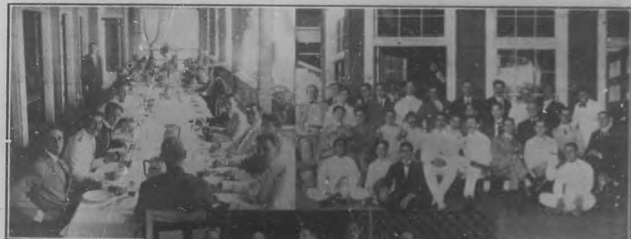
Los alumnos de la Sala de Armas del Ateneo, en Palatino.—Almuerzo.—Grupo de asistentes.—Jurado.