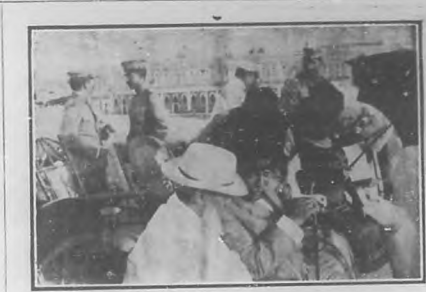
El Presidente de la República, su esposa y otras personas presentando el desfile de tropas.

El regreso de las fuerzas del Ejército y de la Rural que tomaron parte en el paseo militar y maniobras de Pinar del Río, constituyó un acto animadísimo, favorecido por un tiempo espléndido, por concurrencia numerosa que llenaba las calles y paseos, y por los aplausos con que el público saludaba a los expedicionarios y al general Armando de la Riva que los mandaba. El Honorable señor Presidente, con su esposa, y los ayudantes y otras personas, presenció el desfile desde la terraza de la "Punta".